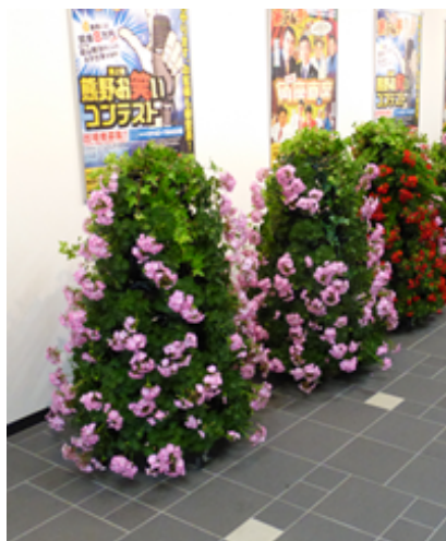
フラワータワー(ゼラニウム)

これは、昨年のまちづくり海外調査団でドイツに視察へ行った方からの報告を受け、今年度実施するものとなります。6月28日開催のいこらい市で飾る予定としておりますので、ぜひお越しく下さい。